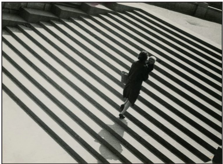
• Alexandre Rodchenko « Escaliers » - 1930