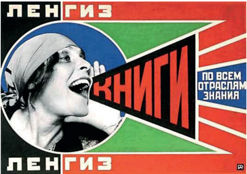
• Alexandre Rodchenko « Plakat » - 1924

Au centre d'examen, à l'issue de l'épreuve, agrafés dans une copie modèle EN :