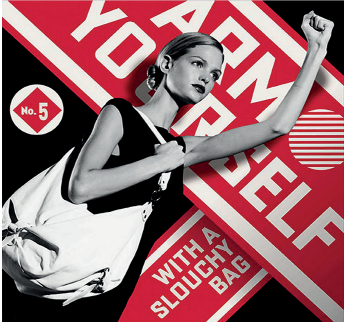
• Shepard Fairey « Armez-vous d'un sac souple » - Publicité pour Saks Fifth Avenue - 2009