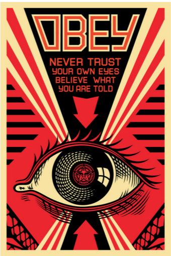
• Shepard Fairey « Obéissez, ne vous fiez pas à vos yeux, croyez ce qu'on vous dit » - 2009