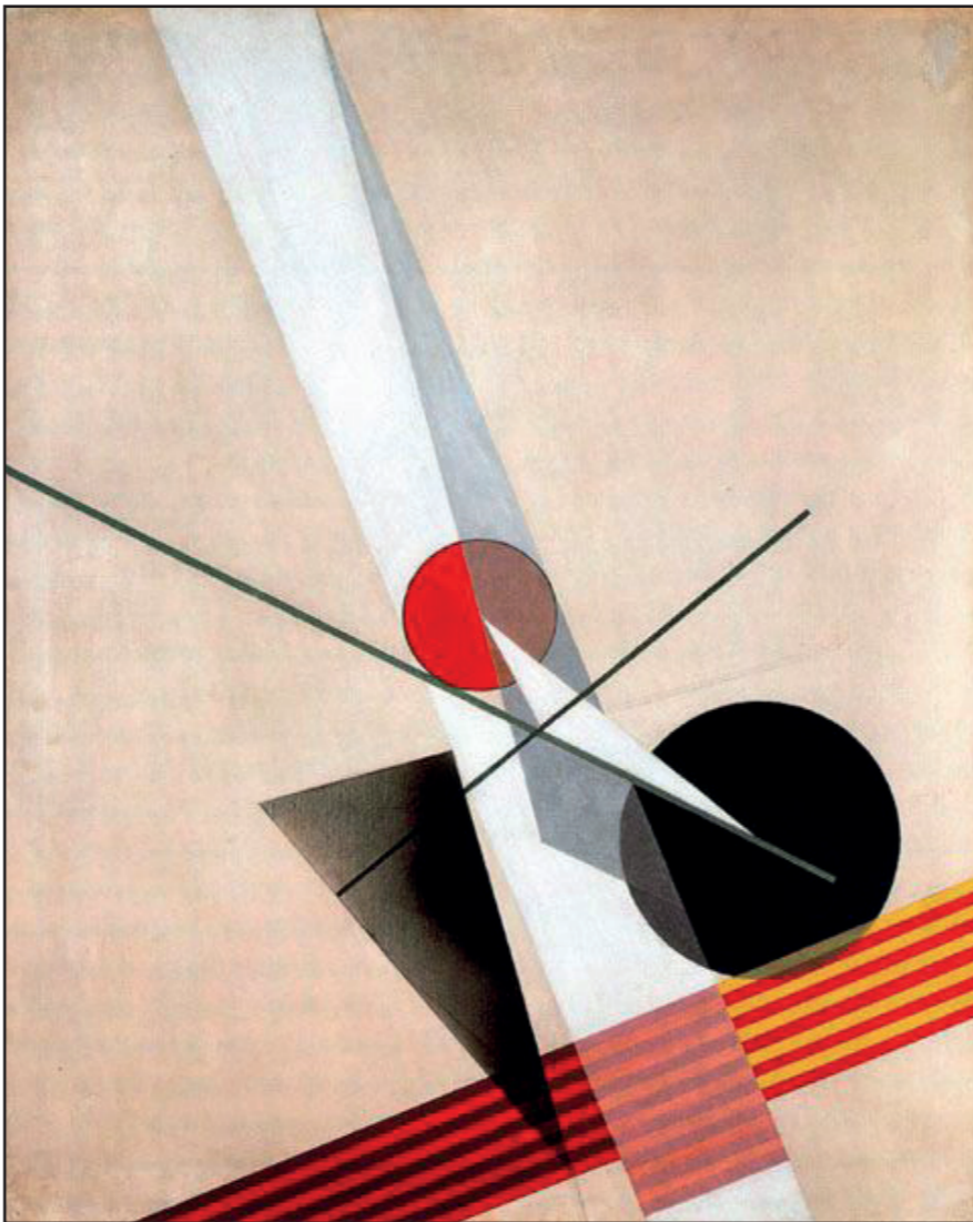
• Lazlo Moholy-Nagy « Composition A XX1 » - 1925