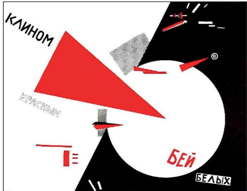
• El Lissitzky « Avec un coin rouge, enfonçons les blancs » - 1920

(3) Chemin d'accès : CAP SDG - EP1 A / Nom-Prénom / Observer, décrire.